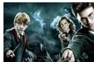
Harry Potter Al cinema La Compagnia

corso a Villa Bardini «Pinocchio, Harry Potter, Topolino, Heidi e tutti gli altri...» (aperta fino al 3 giugno) sulle affiches della storica casa editrice fiorentina Salani. Harry Potter Italiano nasceva 20 anni fa: era il 1998 quando venne pubblicato per la prima volta in Italia «Harry Potter e la pietra filosofale»