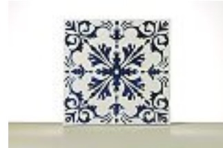
Una piastrella sintetica di Mario Luca Giusti

oggettistica arrivano le piastrelle. Realizzata in melamina la nuova collezione che porta l'evocativo nome di «Tiziano», maestro del colore tonale, oltre che bella è anche antisismica. Da usare sulle pareti ma anche come base per ravvivare anonimi piani di tavole da pranzo sia in interno che, nel più autentico stile Giusti, in